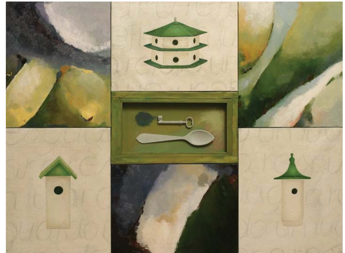
Un lugar a resguardo. 2005 Óleo, acrílico, grafito y objetos sobre lienzo (políptico), 93 x 125 cm.