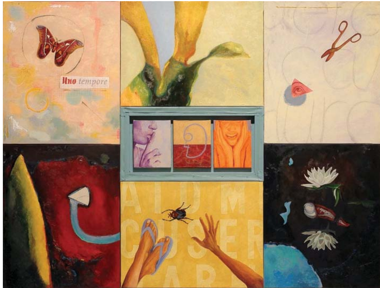
Uno tempore. 2005 Óleo, acrílico y grafito sobre lienzo (políptico), 146 x 193 cm.