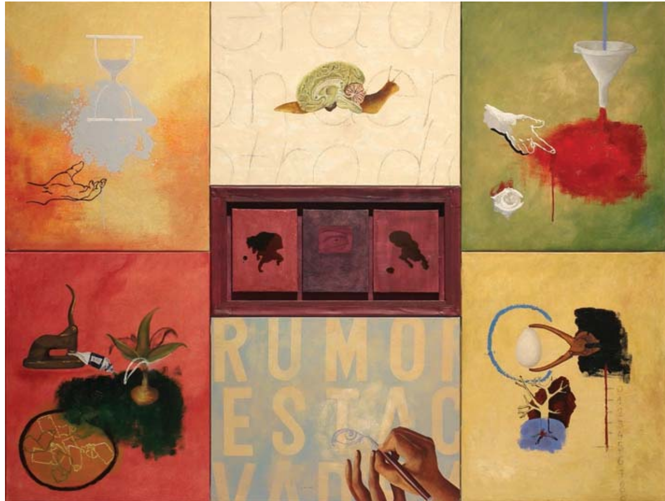
Jornada en blanco. 2005 Óleo, acrílico y grafito sobre lienzo (políptico), 146 x 193 cm.