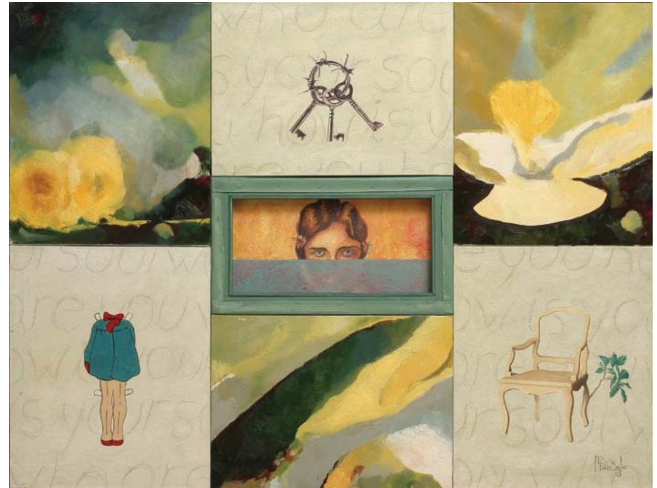
Sin título. 2005 Óleo, acrílico y grafito sobre lienzo y guache sobre papel (políptico), 93 x 125 cm.