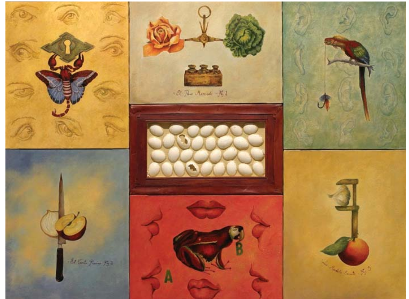
Pequeño bestiario de envidias y maledicencias. 2004 Óleo, acrílico y cáscara de huevo sobre lienzo (políptico), 93 x 125 cm.