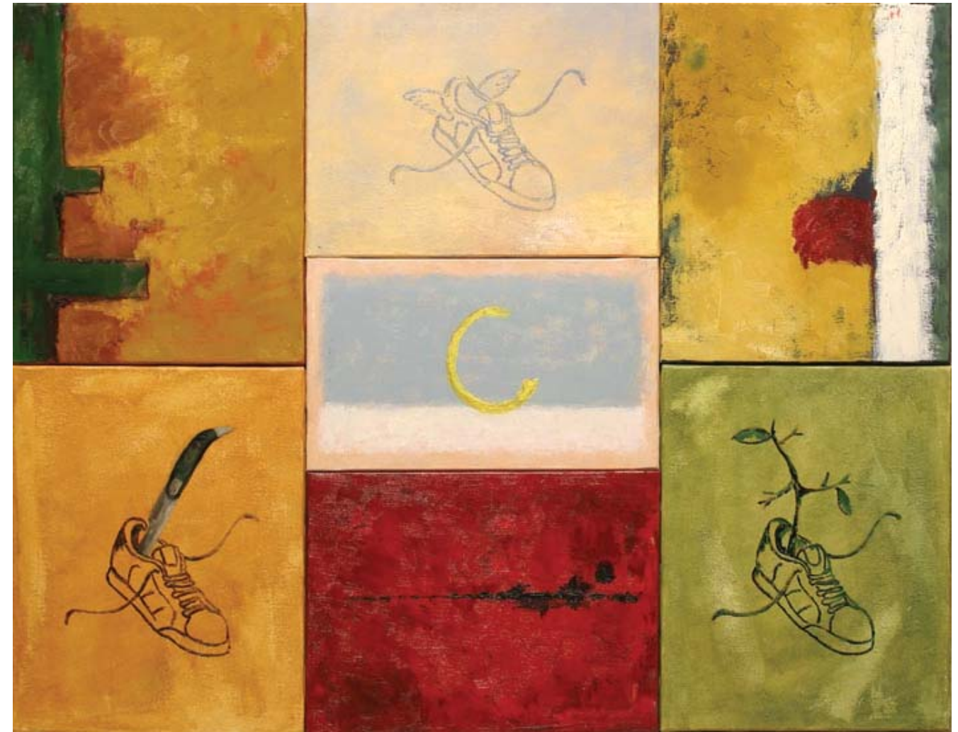
El viaje hasta ayer. 2005 Óleo y acrílico sobre lienzo (políptico), 93 x 125 cm.