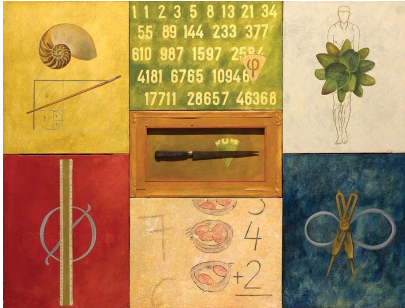
Dos anotaciones a la sección áurea. 2005 Óleo, acrílico y objeto sobre lienzo (políptico), 93 x 125 cm.