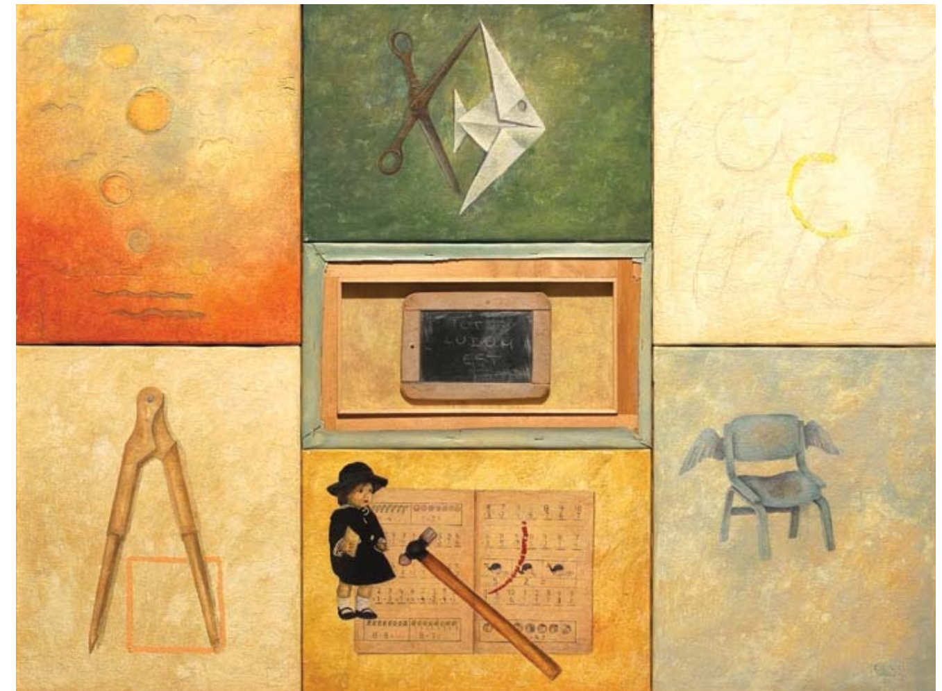
La cuadratura del círculo. 2003 Técnica mixta sobre lienzo y pizarra (poliéptico), 93 x 125 cm.

Los palimpsestos eran en la Antigua Grecia, manuscritos que tienen huella de una escritura anterior. Se borraban y se usaban "de nuevo". En el arte, como en la vida no existe tabla en blanco, somos enanos subidos en hombros de gigantes. Sin memoria es imposible crear, y demasiado pretencioso sería tratar de ser original sin tener en cuenta que somos partes de un todo y que recoger esos vestigios es, lo que nos hace ricos.